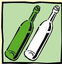
Bunt- bzw. Weißglasbehälter